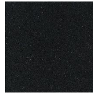
Struktur sort benkeplate